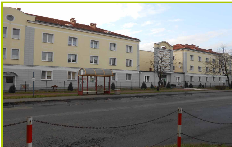
Mieszkania chronione ul. Ludwika Waryńskiego 1-3

Mieszkanie chronione przeznaczone jest dla osób, które ze względu na trudną sytuację życiową, wiek, niepełnosprawność lub chorobę potrzebują wsparcia w funkcjonowaniu w codziennym życiu, ale nie wymagają całodobowej opieki. Miejski Ośrodek Pomocy Społecznej dysponuje 47 lokalami, w tym jedno- i dwupokojowymi.