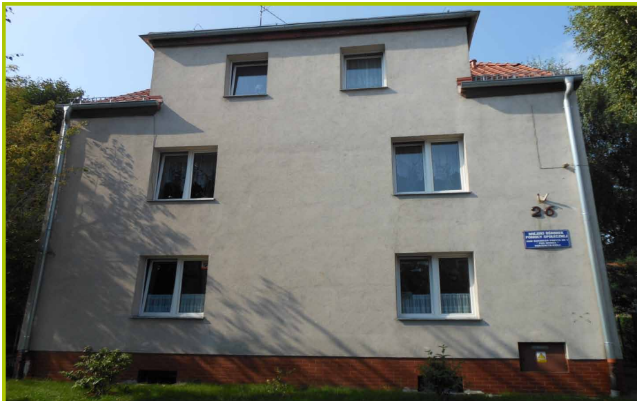
Dom Dziennego Pobytu Nr 1 „Pod brzozą” ul. Powstańców Śląskich 26