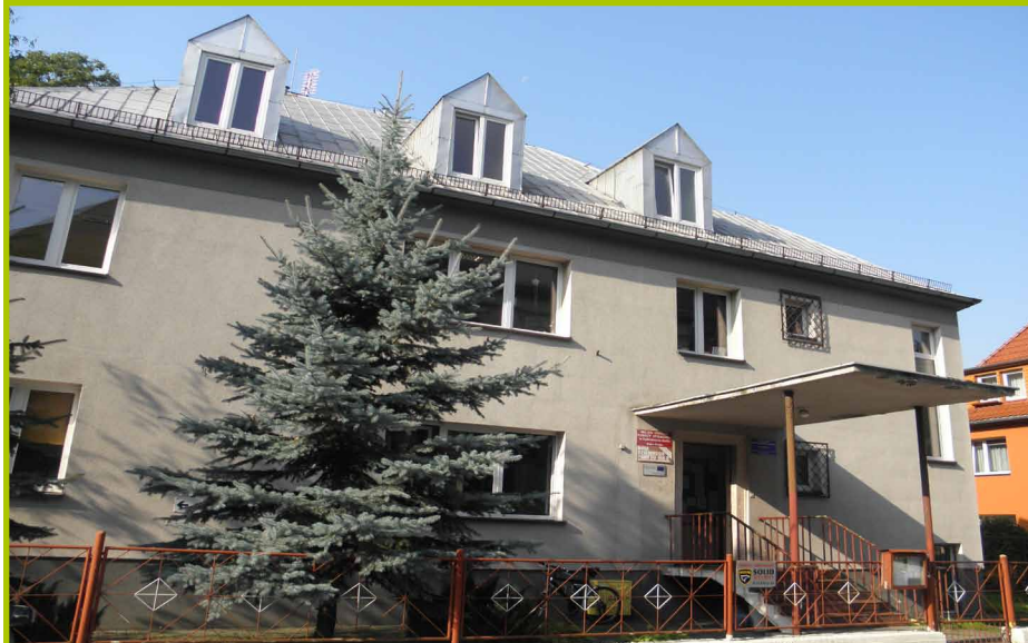
Dom Dziennego Pobytu Nr 2 „Magnolia” ul. Grzegorza Piramowicza 27