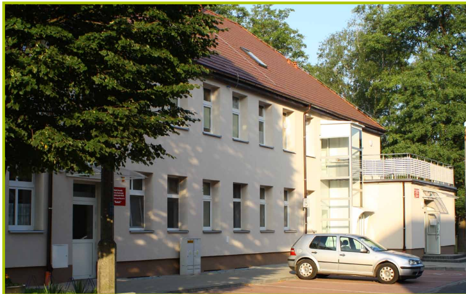
Dom Dziennego Pobytu Nr 3 „Radość” ul. Władysława Grabskiego 6